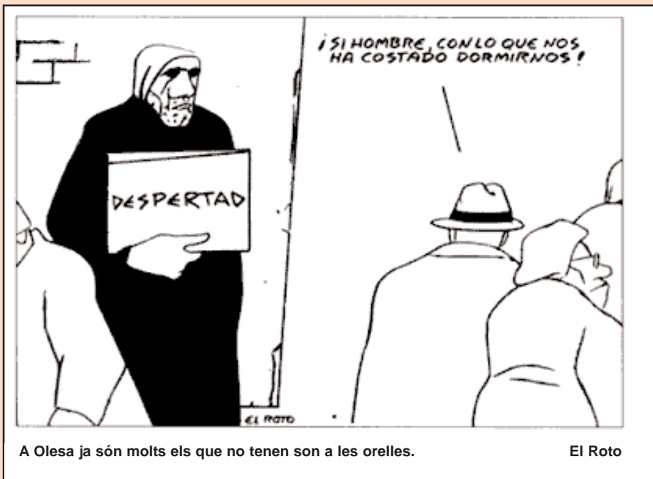
A Olesa ja són molts els que no tenen son a les orelles.

Quan llegim la dita popular que "Cada poble té els governants que es mereix" comprenem aquella altra que diu "Tota regla té la seva excepció". Olesa n'és una.