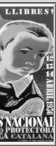
Estudiar el passat

los acusados obtuvieran una tutela judicial efectiva, sin ser informados de la acusación formulada contra ellos, sin la posibilidad de utilizar los medios probatorios mínimos en su defensa, sin que les fuera aplicada la presunción de inocencia. Es decir, los propios golpistas cometieron la indignidad de acusar a sus enemigos del delito por ellos mismos cometido; llegando la sinrazón al punto de considerar materia punible la actuación de los acusados a partir de 1934, ¡dos años antes de iniciarse la contienda! ¿No le parecen, señor Presidente, todos los expuestos, motivos suficientes para la anulación general de los juicios sumarísimos?