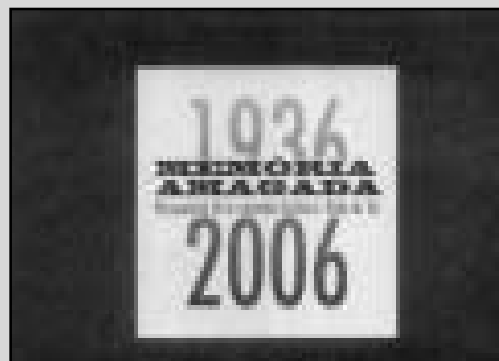
L'any 2006 en va fer 70 de l'inici de la guerra

de los casos de desapariciones forzadas y ejecuciones extrajudiciales durante la guerra civil española y el régimen franquista. Esta Fiscalía podrá actuar de oficio o a instancia de alguno de los sujetos legitimados (familiares, asociaciones, sindicatos, parti-