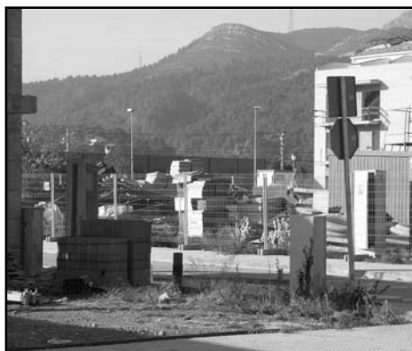
Els solars que van tocar "en sort" a l'Ajuntament són els de costat de la via

Hi ha qui s'omple la boca, sempre que en té ocasió, de l'esquerranisme de la seva ideologia, de mots com justícia social, benestar universal i progressisme conceptual. Però en molts casos, tot això no és altra cosa que retòrica pura i bla, bla, bla.